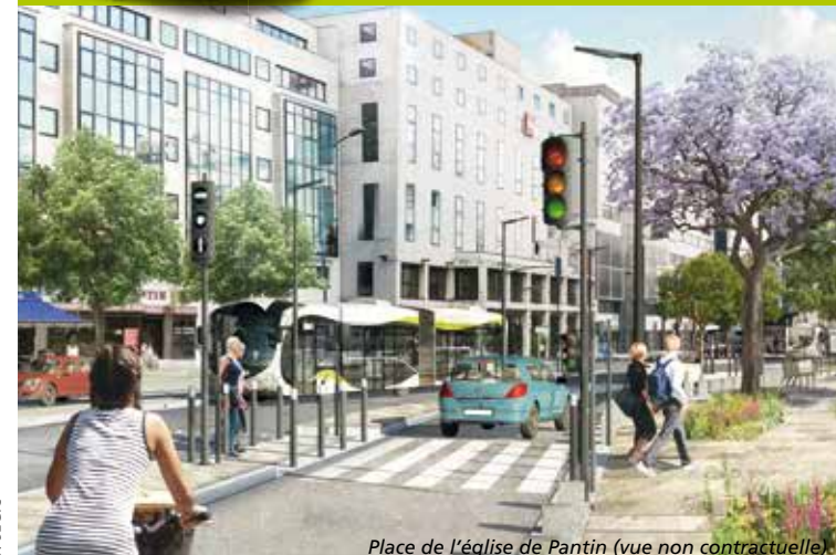
Place de l'église de Pantin (vue non contractuelle)